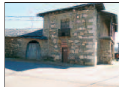
Casa de Zaramayas

Por eso, porque todo es relativo, la conclusión es que mi pueblo me gusta. Rodanillo disfruta de los cultivos habituales de la zona: viñedos, praderas, cereales, productos hortí-