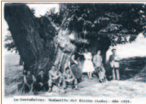
La Castañalona de Rodanillo

Sus castaños, en la variedad llamada berlanga, siguen siendo muy apreciadas por su facilidad para desprenderse de las cáscaras que la recubren. Su grato sabor y alto contenido en azúcares las hace aptas