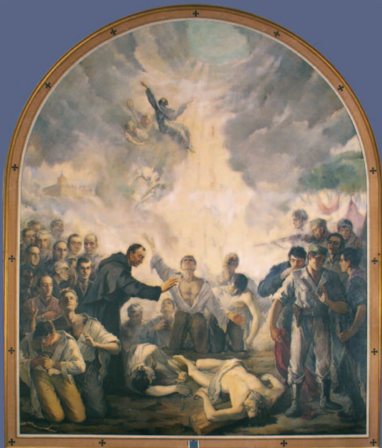
Cuadro Fusilamiento de Agustinos . Sala de Capas de San Lorenzo de El Escorial, pintado por Tavera.

REVISTA DE LA ASOCIACIÓN DE ANTIGUOS ALUMNOS COLEGIO-SEMINARIO SAN AGUSTÍN. SALAMANCA N.º 15 ABRIL 2007