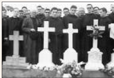
Lápidas de mártires agustinos. Camposanto de Paracuellos