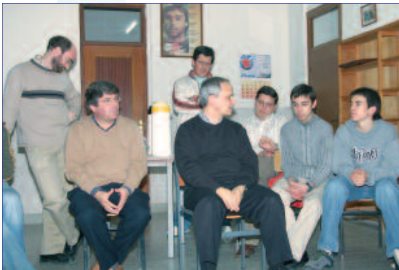
Rvdo. P. Prior General (en el centro) y P. Prior del Colegio con un grupo de alumnos