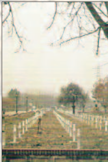
Paracuellos. Cruces del Campo Santo

El 30 de noviembre se organizan las expediciones más numerosas, al menos para los agustinos. Cincuenta