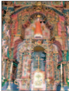
Retablo de la Iglesia de Rodanillo. El patrón, San Antolín

tres arcos cobijan la campanilla de llamar a misa rezada y dos campanas de repique y volteo usadas no sólo para llamar a los servicios del culto más solemnes, sino también para avisar de los fuegos, ahuyentar las tormentas y tocar a público con cejo. Los de Rodanillo siempre creímos firmemente que una de dichas campanas tenía el mejor timbre de todas las campanas del Bierzo; o más.