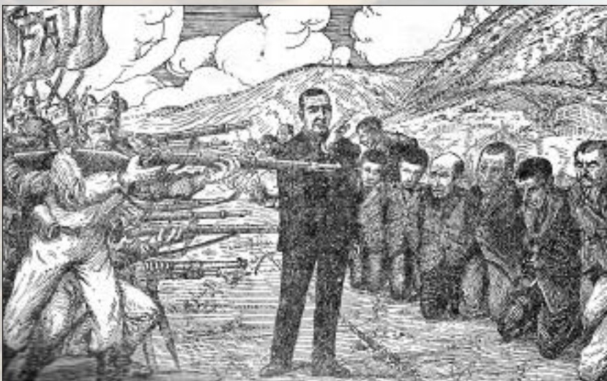
Paracuellos. El P. Avelino bendice y absuelve a sus once hermanos

El mismo día 18 de julio el Real Monasterio quedó oficialmente