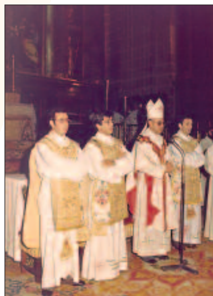
Los ordenados con monseñor Nicolás Castellano