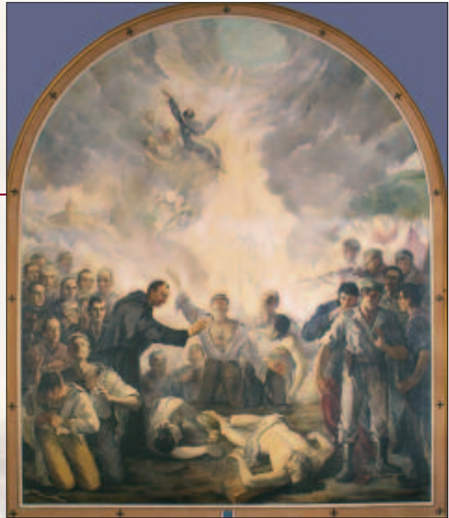
Cuadro de Tavera. Fusilamiento de agustinos

Con el correr de la mañana no llegan los agustinos de Madrid en el tren que se esperaba. El hermano portero llama desde la centralita monástica a la centralita del Real Sitio, una y otra vez, pidiendo contacto con la central telefónica de Madrid, y desde allí con los teléfonos de las casas de agustinos. No se consigue nada. Ante la insistencia de las llamadas, una persona afecta a la comunidad comunica que es imposible. Se han cortado las comunicaciones por orden del Gobierno. Los trenes han quedado suspendidos. A pesar de los ausentes, la fecha revistió la solemnidad esperada. Lo que nadie pensaba era que la fecha iba a ser tan memorable. Con el paso de las horas se sabe que una parte del Ejército se ha sublevado contra el Gobierno. De inmediato la policía bloquea las entradas y salidas del Real Monasterio. ¿Y qué