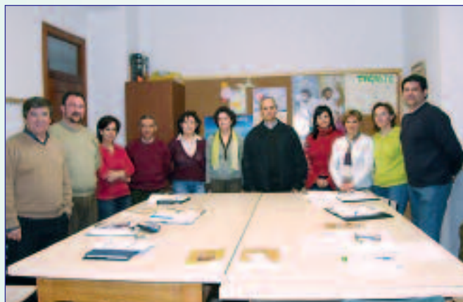
P. General y la Junta de AMPAs.

Pero quiero contaros más sobre la semana vocacional. Fue muy intensa y sirvió para plantearnos todos un poco más la tremenda responsabilidad que tenemos en la promoción de posibles vocaciones a la vida religiosa y sacerdotal. Todo el Colegio fue ambientado con carteles alusivos a estas jornadas y realizamos actividades con