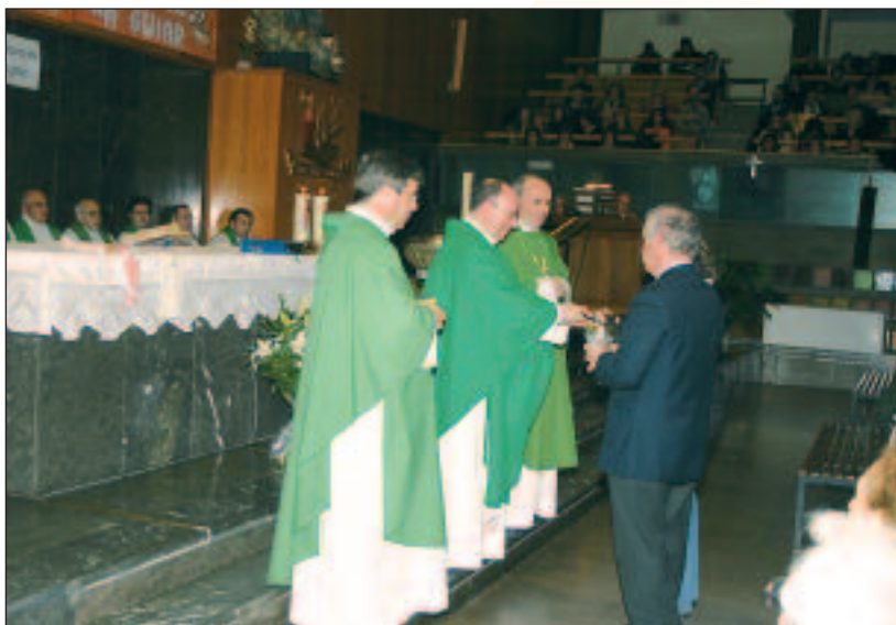
Celebrando la eucaristía 25 años después. 8 de enero de 2007

La verdad es que han sido 25 años plenos y felices. He sido testigo de muchas generaciones que hoy son los "segundos jóvenes" de la Provincia. Sería interminable la lista de nombres, unos agustinos hoy, y muchos, siempre agustinianos, por los diversos caminos de la vida. Me